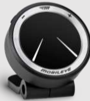
Alerta depasire banda