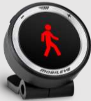
Alerta pieton sau ciclist