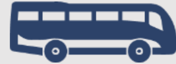
Autobuze și autocare