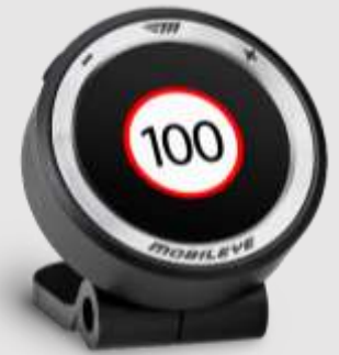
Indicare vitezei limita