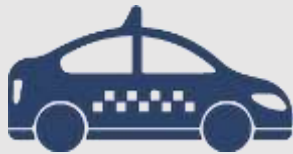
Ride Sharing și taxiuri