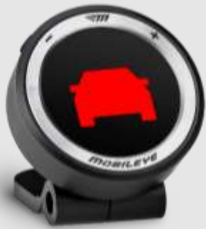
Alerta coliziune frontala