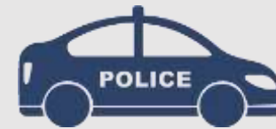
Forțe de ordine