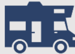
Rulote și RV-uri